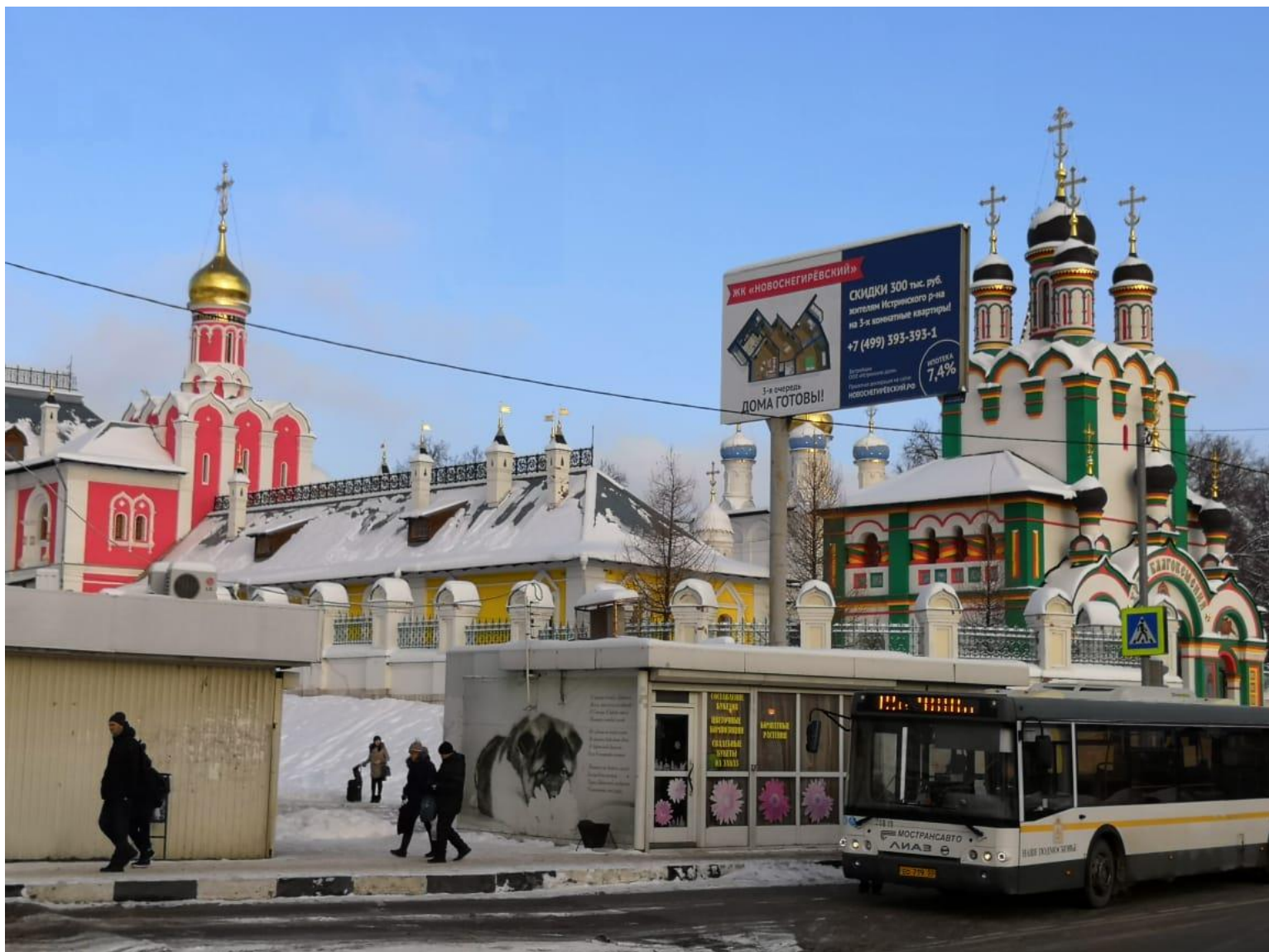
Снимок 3. Рекламная конструкция № 716 (слева) и № 676 (справа)